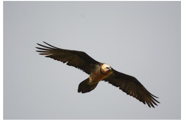
Bartgeier Sardona, Foto: Franziska Lörcher